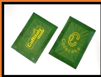
Retino durevole in varie misure