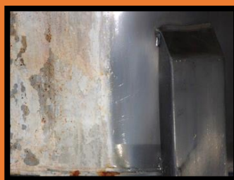
Ripristino di serbatoio e ringhiera in Aisi 304