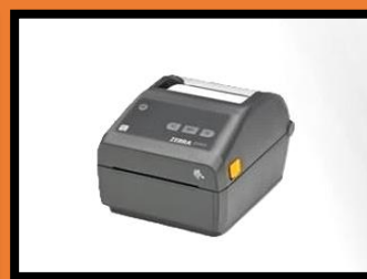
Stampante per retino usa e getta