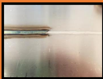
Decapaggio con pennello Brush